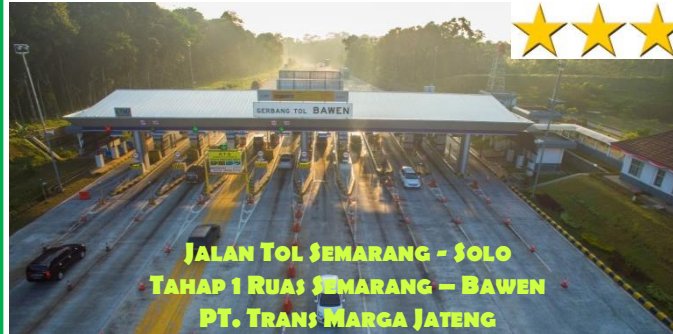
JALAN TOL SEMARANG - SOLO TAHAP 1 RUAS SEMARANG – BAWEN PT. TRANS MARGA JATENG