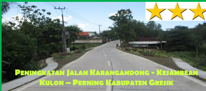
PENINGKATAN JALAN KARANGANDONG - KEJAMBEAN KULON – PERNING KABUPATEN GRESIK