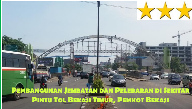
PEMBANGUNAN JEMBATAN DAN PELEBARAN DI SEKITAR PINTU TOL BEKASI TIMUR, PENKOT BEKASI