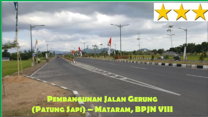
PEMBANGUNAN JALAN GERUNG (PATUNG SAPI) – MATARAM, BPJN VIII