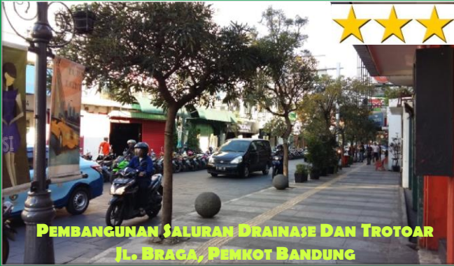
PEMBANGUNAN SALURAN DRAINASE DAN TROTOAR Jl. BRAGA, PENKOT BANDUNG