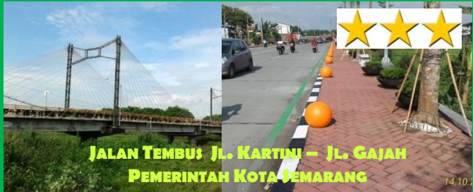
JALAN TEMBUS: Jl. KARTINI – Jl. GAJAH PEMERINTAH KOTA SEMARANG